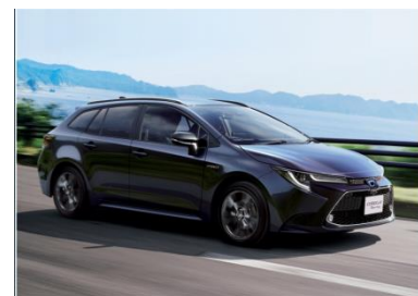
<新型カロラツーリング>