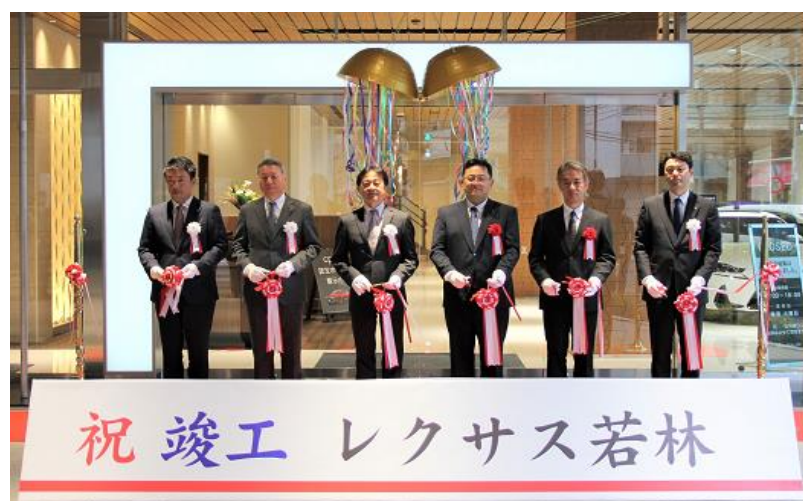
オープンセレモニーの様子 (2020年1月15日)