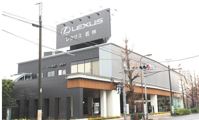
約73mの広い間口を有する レクサス若林 外観