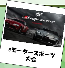
eモータースポーツ 大会