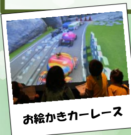
お絵かきカーレース

はじめましてトヨタモビリティ東京です この度、有明ガーデンの仲間になります 地域の皆様と有明の持続可能な未来の創造を目指し 「有明ミライエ」と名付けました 大人も子供も楽しめる集いの場所を作っていきます