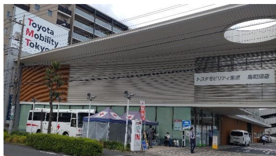
<店舗敷地に献血車（南町田店）>

当社はこれからも東京都赤十字血液センターと連携し、本社ビルや店舗での献血を実施することで、SDGs 達成に貢献していく。