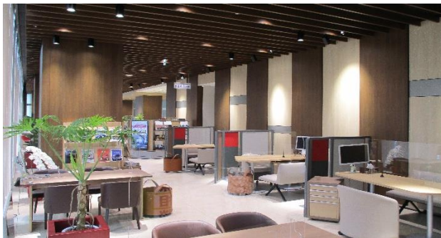
〈空調・照明が自動調整されるショールーム〉