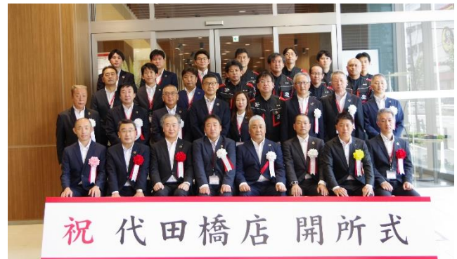
〈開所式の記念撮影〉