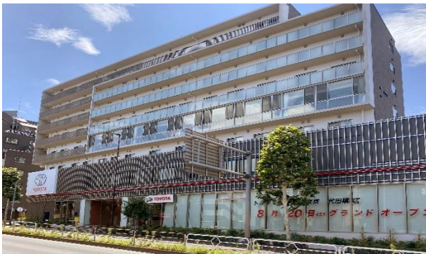
〈環状七号線に面した代田橋店〉