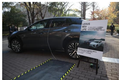
【 電力供給中 】