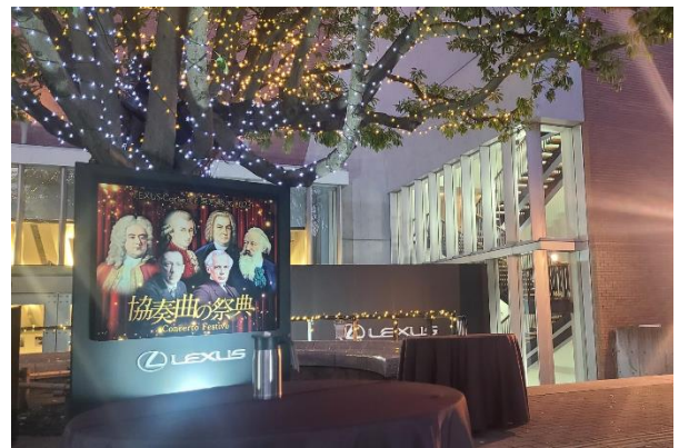
【 夜間ライトアップ 】

休憩時間には来場者へケータリングを提供。ケータリングスペースの照明は、展示車のRZ450eから電力を供給し、環境配慮と進化するライフスタイルの取組みを披露した。