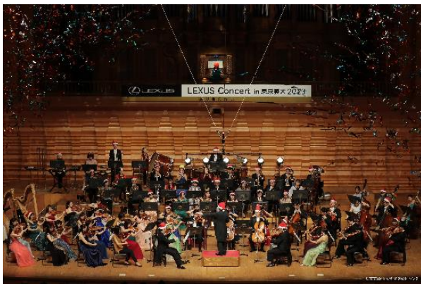
【 レクサス特別オーケストラ 】

今年のコンサートテーマは、「協奏曲」。数年の時を経て日常が戻りつつある現在、これからの未来はレクサスとお客様がともに歩み、創り出すと言うメッセージを、協奏曲というテーマで表現した。指揮に同大学卒業で国際的に高評価を得ている大井剛史氏、演奏に東京藝術大学レクサス特別オーケストラを編成し、充実のソリスト陣とともに、約90名による豪華でダイナミックな演奏が会場に響き渡った。