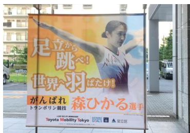
〈ショールームに掲示した大型タペストリー〉

https://www.toyota-mobi-tokyo.co.jp/corporate/athleteyell/vol_01