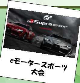
eモータースポーツ 大会