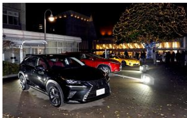
&lt;会場前に展示されたレクサスとクリスマスツリー&gt;